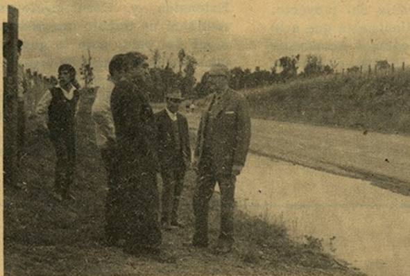
Rector en Campamento "Futacullín", Osorno, en conversación con campesinos.