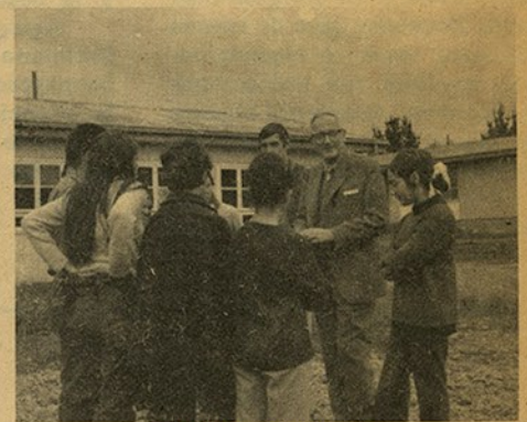
Rector en Campamento "Entre Lagos", Osorno.