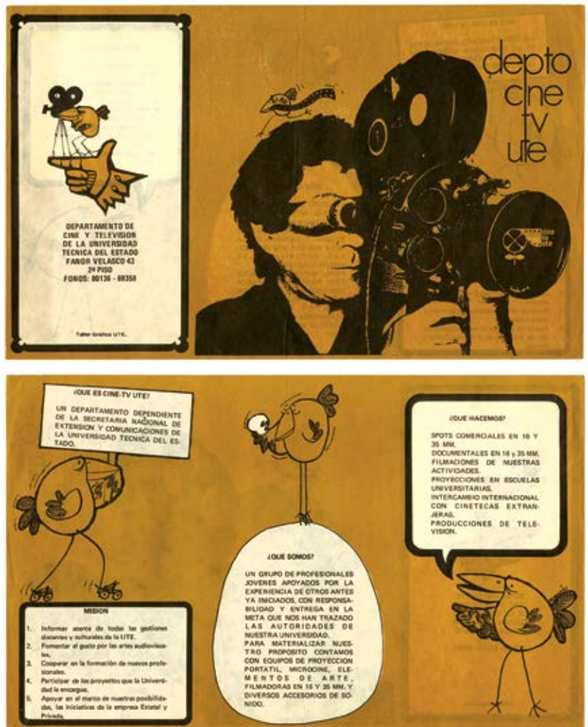
Folleto del Departamento de Cine y TV UTE, donde se explican sus funciones y las actividades de los integrantes de la unidad.

En las películas, se buscó transmitir un mensaje concreto y directo, para promover la adhesión de la ciudadanía a las transformaciones económicas y sociales promovidas por el gobierno de la Unidad Popular. Este tipo de mensaje es característico de los documentales expositivos, donde la argumentación es un aspecto fundamental al intentar transmitir un punto de vista del mundo y de la realidad. Esta argumentación, en el caso de las producciones de la UTE, fue explícita, en general apoyada en una voz en off y en testimonios de los actores involucrados; según Nichols, este tipo de filmaciones “se basa considerablemente en la palabra hablada. El comentario a través de la voz en off de narradores, periodistas, entrevis-