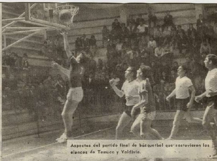
Aspectos del partido final de básquetbol que sostuvieron los elencos de Temuco y Valdivia.