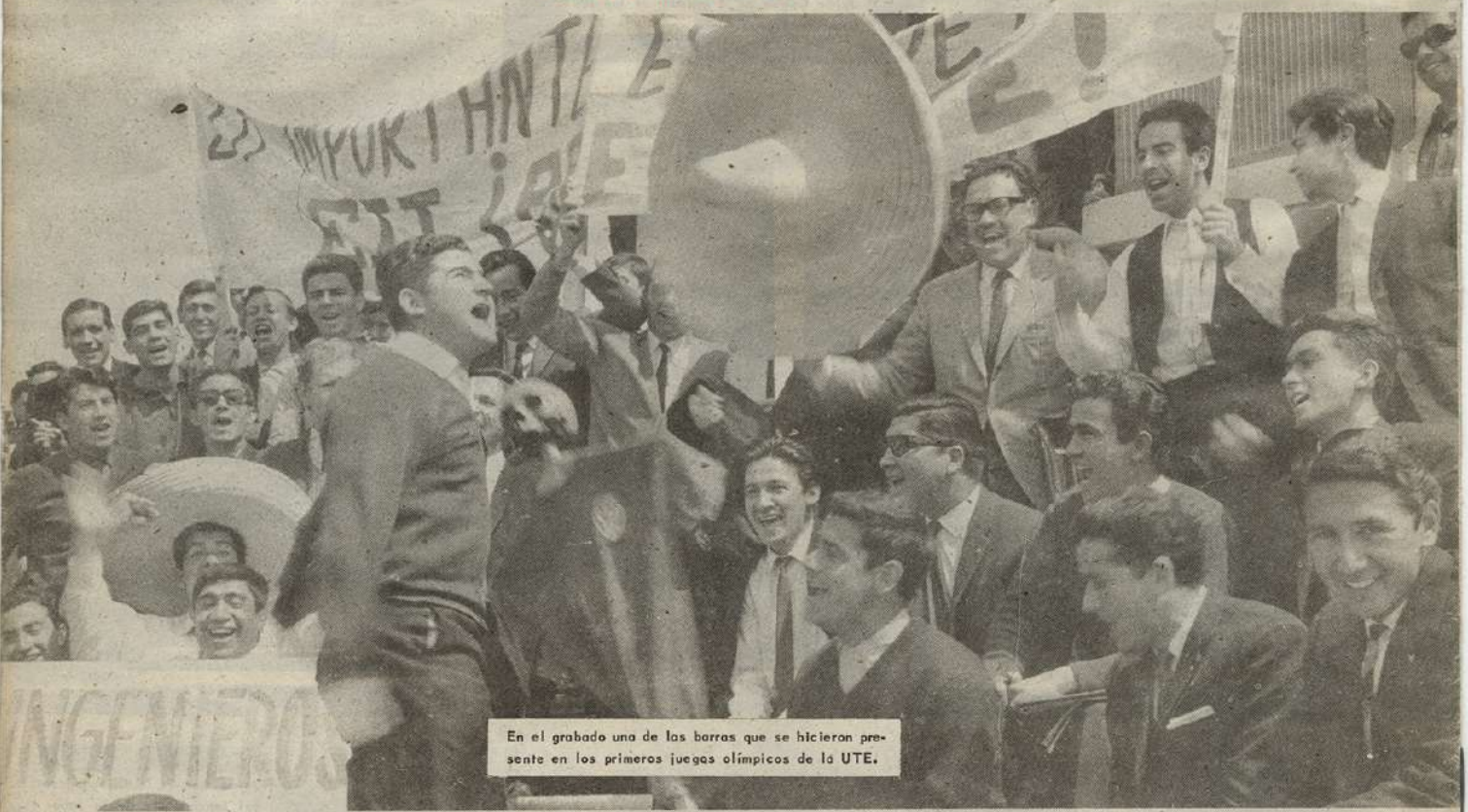
En el grabado una de las barras que se hicieron presente en los primeros juegos olímpicos de la UTE.