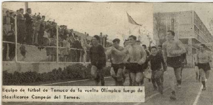
Equipo de fútbol de Temuco da la vuelta Olímpica luego de clasificarse Campeón del Torneo.