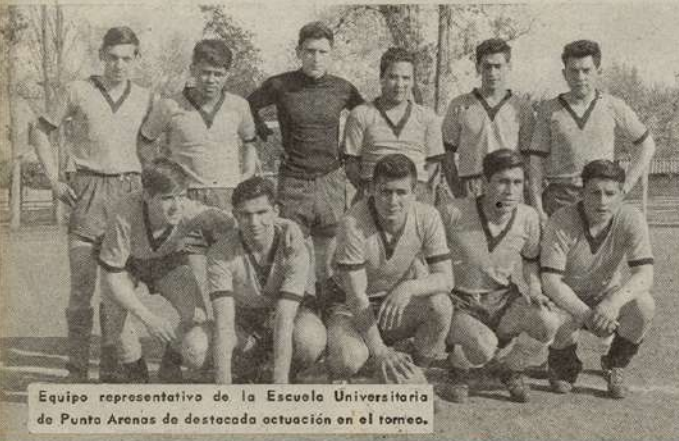
Equipo representativo de la Escuela Universitaria de Punta Arenas de destacada actuación en el torneo.