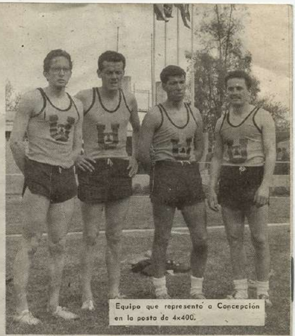
Equipo que representó a Concepción en la posta de 4x400.

Durante la recepción ofrecida a las delegaciones asistentes, se hizo entrega de los diversos trofeos ganados por los equipos y planteles ganadores.