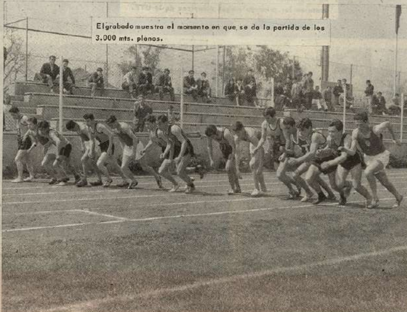
El grabado muestra el momento en que se da la partida de los 3.000 mts. planos.