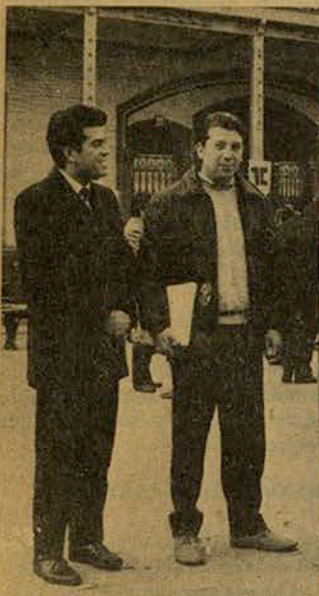
Ejecutivo Nacional FEUT en el I Congreso de la Reforma.

designó como máxima autoridad del torneo al Rector de la Corporación.