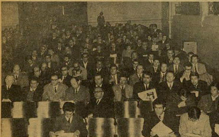
Una sesión de trabajo en el teatro de la EAO.

El Congreso de la Reforma realizado en Santiago por toda la Comunidad de la Universidad Técnica del Estado sancionó un nuevo Estatuto Orgánico que consagra a la UTE como una universidad estatal, nacional, autónoma, unitaria y de funcionamiento descentralizado.