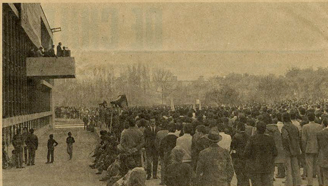
Un impresionante público formado por estudiantes, funcionarios, docentes y pobladores escucha al Rector Kirberg en los momentos que le da la bienvenida al Presidente Allende que visitó la UTE con motivo de la inauguración del Año Académico.

Yo le doy la bienvenida y le digo "Presidente usted llega a su casa".